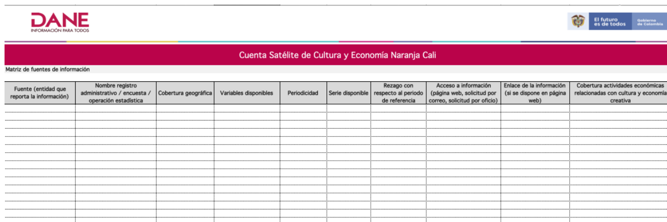
Tabla 2. Formato matriz fuentes de datos CSCENC